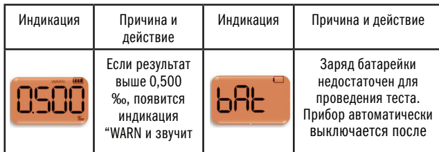
Таблица неисправностей и предупреждений